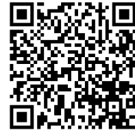
↑出欠連絡フォーム